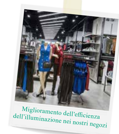
Miglioramento dell'efficienza dell'illuminazione nei nostri negozi