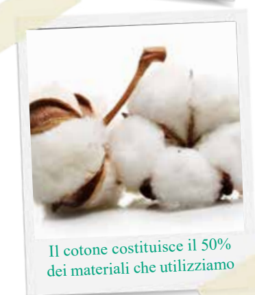
Il cotone costituisce il 50% dei materiali che utilizziamo