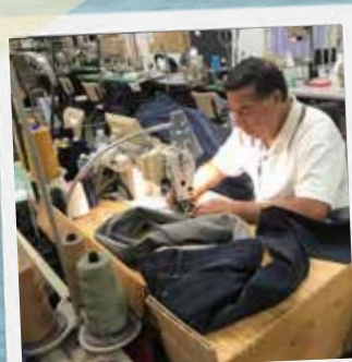
Lavoratore intento al confezionamento di capi GUESS