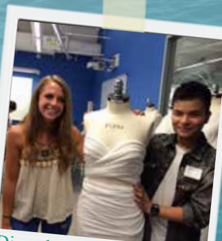
Dipendenti GUESS durante il corso di eco-design