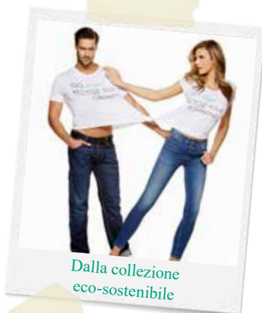
Dalla collezione eco-sostenibile