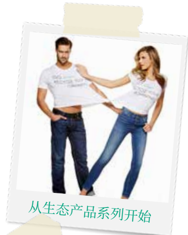
从生态产品系列开始