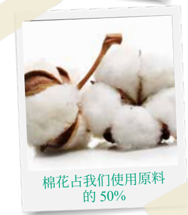
棉花占我们使用原料的 50%