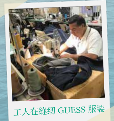
工人在缝纫 GUESS 服装