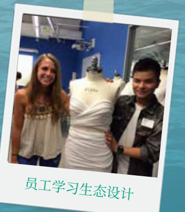
员工学习生态设计